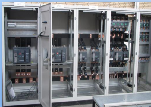
Distribution Panel (Rittal)