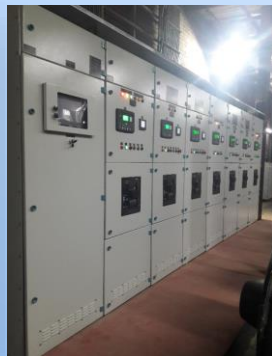
Synchronizing Panel (Sivacon)