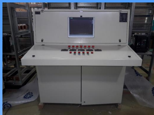
CCP Piano Desk (EGN)