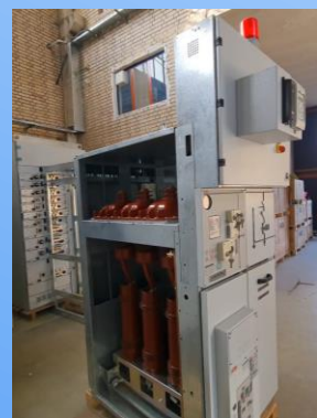
UniSec (MV, AIS, Compact)