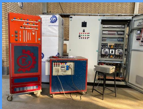
Draw out test Panel (Sivacon)