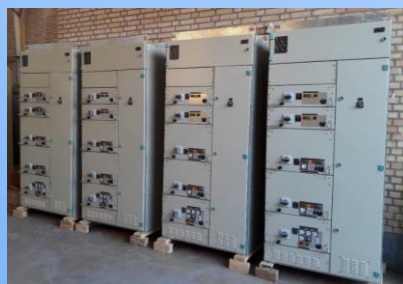
Withdrawable Panel (Sivacon)