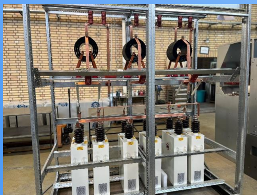
MV Capacitor Bank 6.6 KV