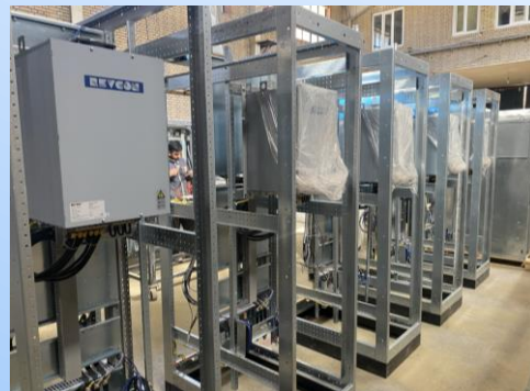
VFD Panel (Sivacon)