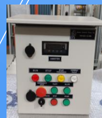
LCS/LCB/JB Panels (EGN)