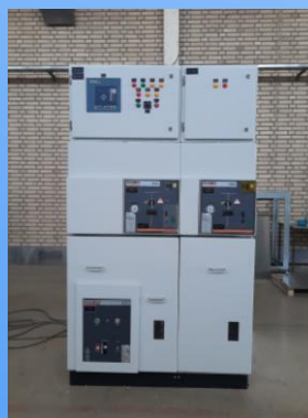
UniSwitch (MV, AIS, Compact)