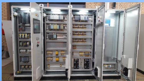
Automation & PLC Panel (Rittal)